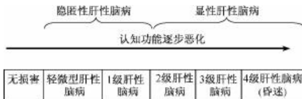
图1 West-Haven 分级与 SONIC 分级的对应关系

由于 West-Haven 分级标准很难区别0级和1级,特别是1级肝性脑病中,欣快或抑郁或注意时间缩短等征象难以识别。因此,近年 ISHEN 指南认为,慢性肝病患者发生肝性脑病是一个连续的过程,因此又制定了称为 SONIC 的分级标准,即将轻微型肝性脑病和 West-Haven 分级1级的肝性脑病归为“隐匿性肝性脑病(covert hepatic encephalopathy, CHE)”,其定义为有神经心理学和(或)神经生理学异常但无定向力障碍、无扑翼样震颤的肝硬化患者。将有明显肝性脑病临床表现的患者(West-Haven 分级标准中的2、3和4级肝性脑病)定义为“显性肝性脑病(overt hepatic encephalopathy, OHE)” [7] ,但是在中国缺乏应用经验,因此本共识仍按轻微型肝性脑病和肝性脑病分类。(编者注:在符合 West-Haven 分级标准1级的患者中,大部分无扑翼样震颤,按 SONIC 分级标准属于 CHE;少部分有扑翼样震颤,按 SONIC 分级标准属于 OHE。两种分级方式的大致对应关系见图1和表4。)